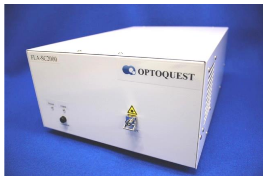
250(W) × 350(D) × 130(H)mm(突起部を除く)

スーパーコンティニューム(SC)発生に特化した独自パルスシーダを用いた、安定度の高い広帯域光源です。従来のSC光源にはない平坦なスペクトル形状と、ASE光源並みの高い安定性を有します。光部品用の検査光源や理化学用途の広帯域光源など、広くお使いいただけます。